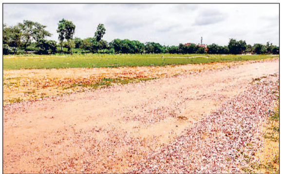
महेन्द्रगढ़। राजकीय कॉलेज के खेल में मैदान में डाले गए रोड़े।

18 मई को सीएम के उड़न खटोले के लिए राजकीय कॉलेज के खेल मैदान में रोड़े डाले गए थे तब सरकार ने इसे नहीं हटाया। खिलाड़ी परेशान हो रहे हैं।