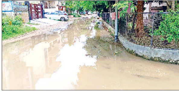
नारनौल। हुडा सेक्टर में सड़क पर भरा बरसात का पानी व लोगों के बीच जाकर हुडा की समस्या जानते हुए।

उल्लेखनीय है कि नारनौल शहर में डीसी रेंजिडेंट के साथ हुडा का एक सेक्टर तैयार किया गया है, जो वर्ष 1998 से अस्तित्व में आया था। तभी से यहां कोठियां बनाकर लोग रहने लगे, लेकिन अफसोस की बात है कि यहां के लोग बेशक अपना गांव-गली छोड़कर यहां बस गए, लेकिन उन्हें पॉश कॉलोनी जैसी सुविधाएं कभी नहीं मिली। गंदगी, खरपतवार, आवारा पशु यहां