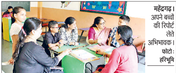
महेंद्रगढ़। अपने बच्चों की रिपोर्ट लेते अभिभावक।