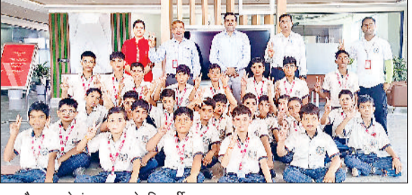
नारनौल। दा वेदांता स्कूल के विद्यार्थी।