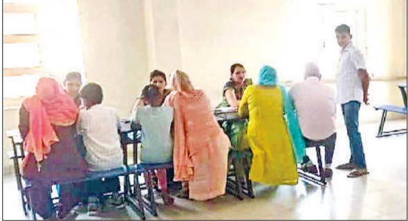
कनीना। बैठक में विद्यार्थियों की समस्याओं पर विचार विमर्श करते शिक्षक व अभिभावक।