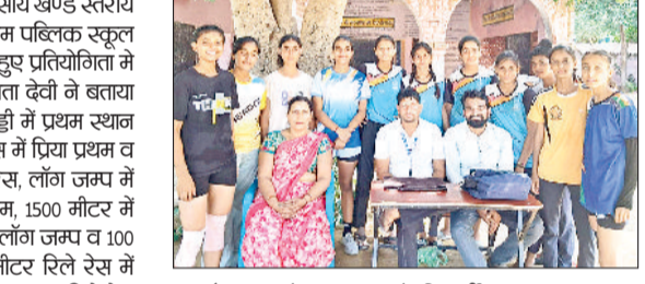
नारनौल। राव नेतराम स्कूल के विद्यार्थी व स्टाफ सदस्य।