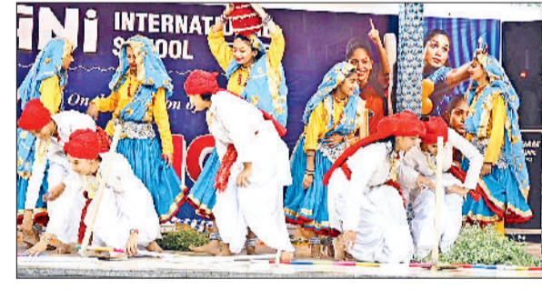
महेंद्रगढ़। कार्यक्रम में अपनी प्रस्तुति देते विद्यार्थी।